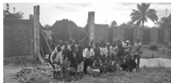
I ragazzi dell'Associazione all'ingresso del Centro Stefano Amadu

Nella città di Uvira in Congo, l'Associazione dei ragazzi e giovani lavoratori è formata di 14 cooperative di ragazzi dai 7 ai 25 anni. Il loro desiderio è di dotarsi di un centro polivalente nel quale esercitare il proprio mestiere remunerativo e far crescere l'associazione. Hanno deciso di chiamarlo Centro Stefano Amadu